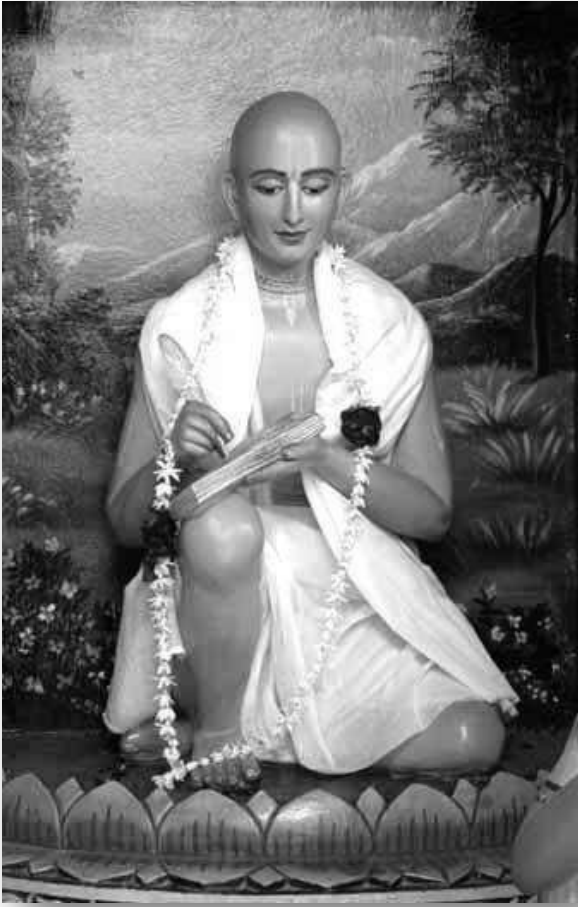
ŚRĪLA RŪPA GOŚVĀMĪ